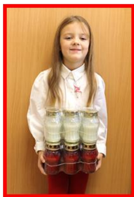
Fundacja Studio Wschód i TVP Polonia pod patronatem Dolnośląskiego Kuratora Oświaty