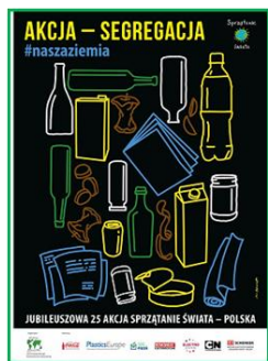
XXV akcja „Sprzątanie Świata – Polska 2018” „AKCJA - SEGREGACJA”.