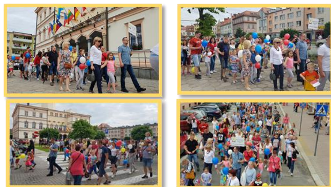
Obchody Dni Ziemi Strzeleckiej. KOROWÓD 02 VI 2019r.

Inne wydarzenia – aktywny udział przedszkola w ogólnopolskich programach edukacyjnych i akcjach społecznościowych.