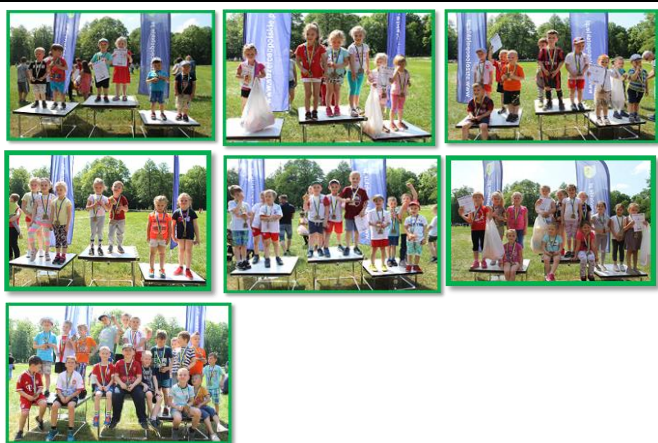
XXI BIEG STRZELCA liczny udział przedszkolaków – 7 grup. 01 VI 2019r